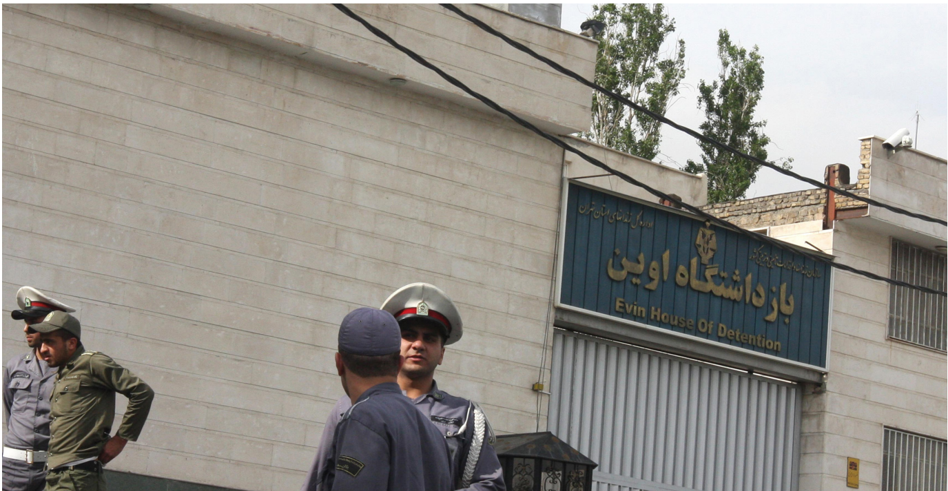
نمایی از در ورودی زندان اوین.

این شهادت نشان‌دهنده نقض موازین تعیین شده توسط سازمان ملل متحد برای کشورهای عضو می باشد. « حداقل مقررات معیار سازمان ملل متحد برای رفتار با زندانیان » اعلام می‌دارد که در بندهای زندانها «همه محل‌هایی که برای استفاده زندانیان در نظر گرفته شده و به‌ویژه همه محل‌های خواب باید از همه امکانات بهداشتی برخوردار باشند، توجه لازم به شرایط آب و هوای آن و به ویژه به مقدار هوا، حداقل مساحت کف، نور، گرما و تهویه مبذول شود.» ۳۱