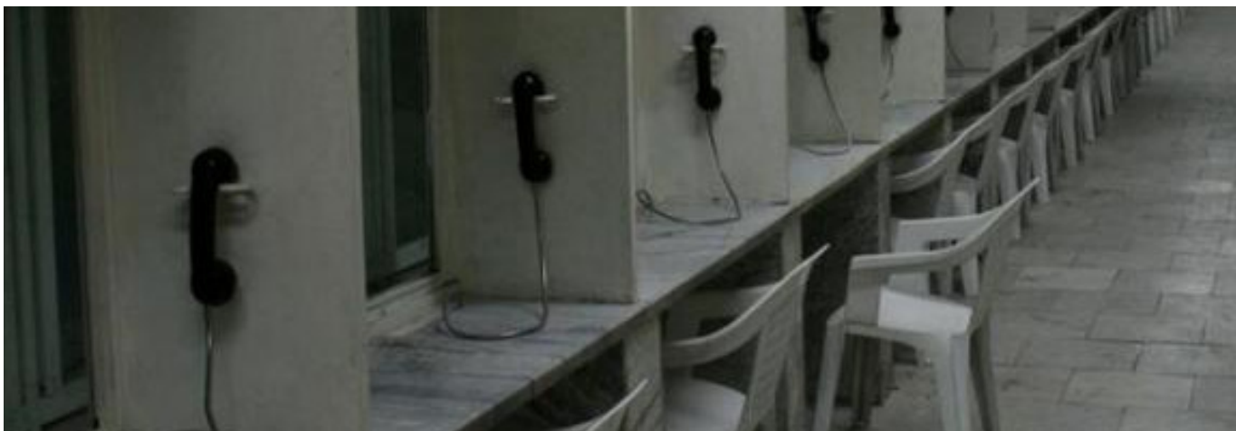
نمایی از اتاق ملاقات کابینی زندانیان در زندان اوین.

(نام زندانی حذف شده است) از امریکا اومد که (نام زندانی حذف شده است) رو ببینه ولی چون شناسنامه ش رو امریکا جا گذاشته بود چندبار اجازه ملاقات ندادند.