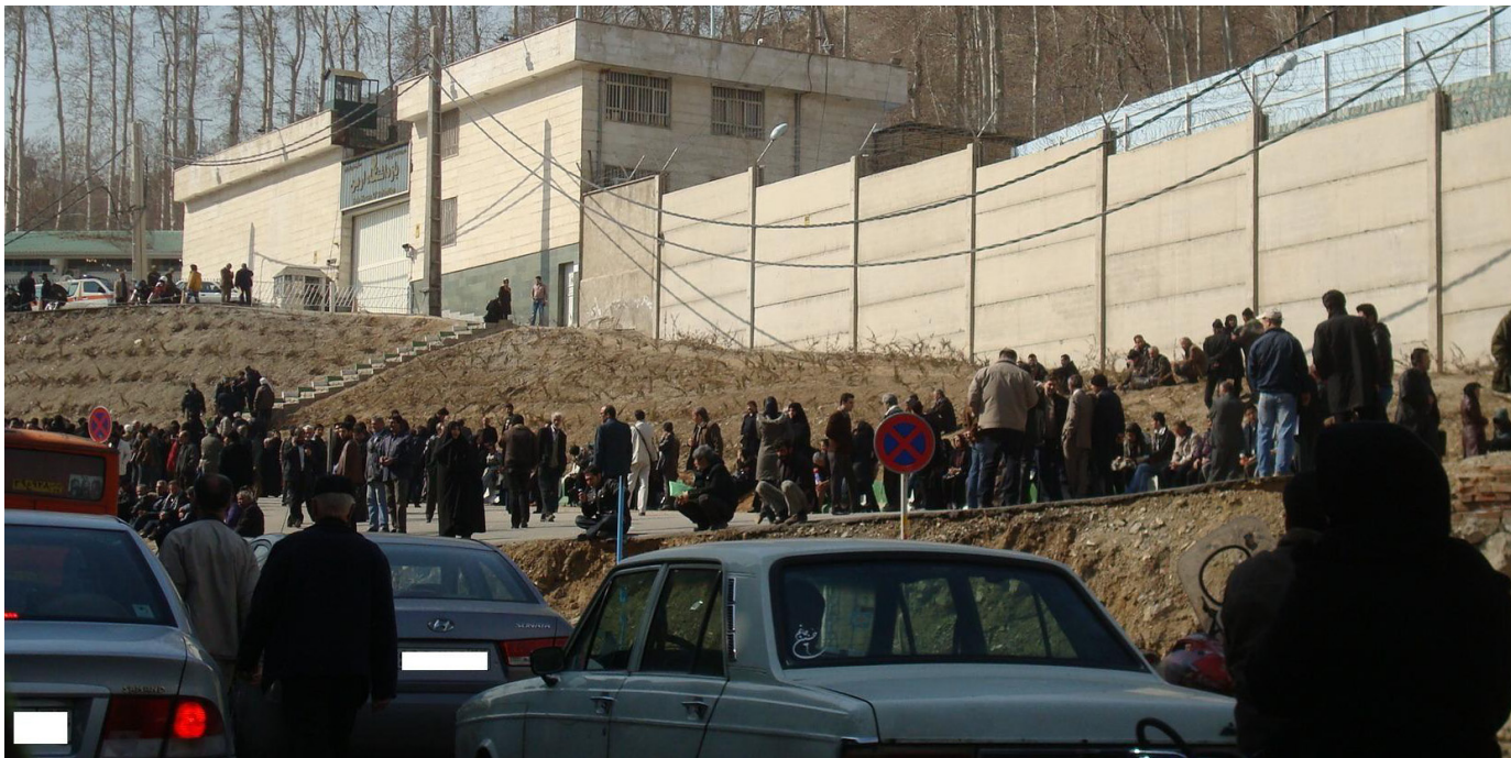
هر روز خانواده‌های بسیاری برای ملاقات با زندانیان به سمت زندان اوین روانه می‌شوند. جلوگیری از ملاقات با خانواده‌ها در برخی موارد به عنوان مجازات برای زندانیان عقیدتی استفاده شده است.

عدم دسترسی به این وسیله ارتباطی بین زندانیان و خانواده هایشان، به ویژه بین مادران و فرزندان خردسالشان، نمونه دیگری از شرایط تنبیهی اعمال شده بر زندانیان بند زنان اوین است.