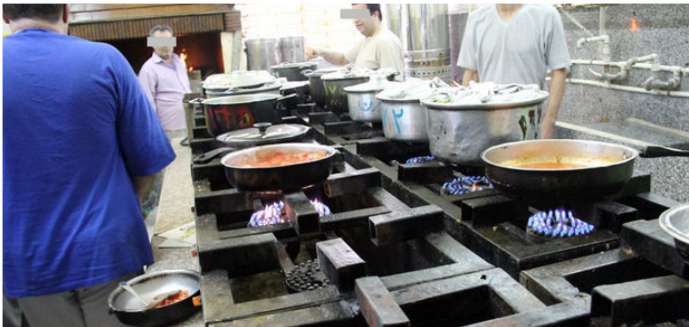
کیفیت غذای ارائه شده در بند زنان زندان اوین به گواه برخی از زندانیان حاضر و با سابق این زندان کیفیت بسیار پایینی دارند به نحوی که زندانیان مجبور می‌شوند غذای خود را از فروشگاه زندان فراهم کنند.