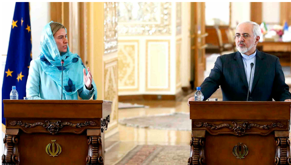
مسئول سیاست خارجه اتحادیه اروپا در یک کنفرانس مطبوعاتی با جوادظریف، وزیر امورخارجه ایران دیده می شود. مقامات ایرانی بارها از علاقه مندی خود به طرح مسائل حقوق بشر در قابل طرح موسوم به «گفت‌وگوهای انتقادی» سخن گفته‌اند. اگر چه در برابر درخواست‌های کشورهای مختلف جهان برای بهبود وضعیت حقوق بشر، اقدام مثبتی انجام نداده اند.

۴. در کلیه مجامع چند جانبه، از جمله مجمع عمومی سازمان ملل و شورای حقوق بشر، خواستار رعایت فوری دولت ایران از کلیه تعهدات بین المللی که کشور ایران به انجام آنها متعهد شده در مورد رفتار با زندانیان، به ویژه ضرورت درمان کامل و به موقع پزشکی، شوید.