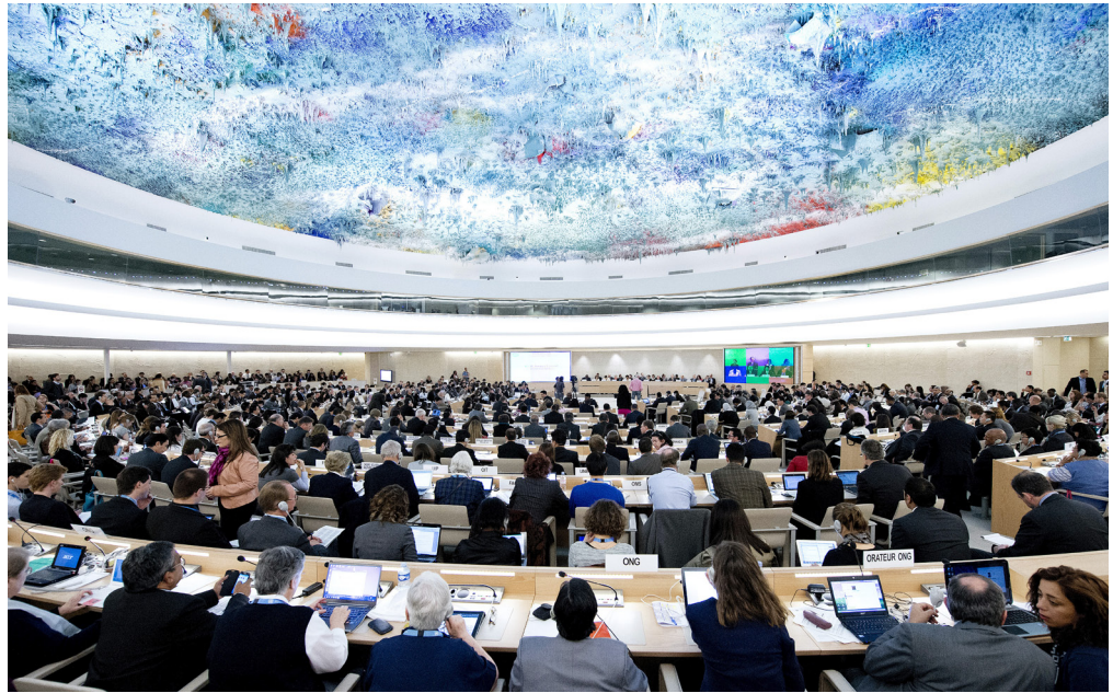
نمایی از شورای حقوق بشر ملل متحد در شهر ژنو، شورایی که در سال ۲۰۱۱ احمدشهیید را به عنوان گزارشگر ویژه حقوق بشر در امور ایران برگزید.