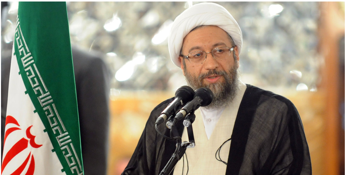
صادق آملی لاریجانی، رئیس قوه قضاییه ایران، مسوولیت کامل آن چه در زندان های ایران می گذرد را به عهده دارد.

قوه قضاییه، به ریاست صادق آملی لاریجانی، اقتدار آشکاری بر زندگی زندانبان جمهوری اسلامی دارد. به همین دلیل باید پاسخگوی این موارد نقض باشد و باید مسئولیت رفع آنها را به عهده بگیرد. این اظهارات نشان می دهد که مقامات ایران از موارد نقضی که در بند زنان صورت گرفته مطلع شده اند. قوه قضاییه باید در خصوص تحقیق در مورد شرایطی که