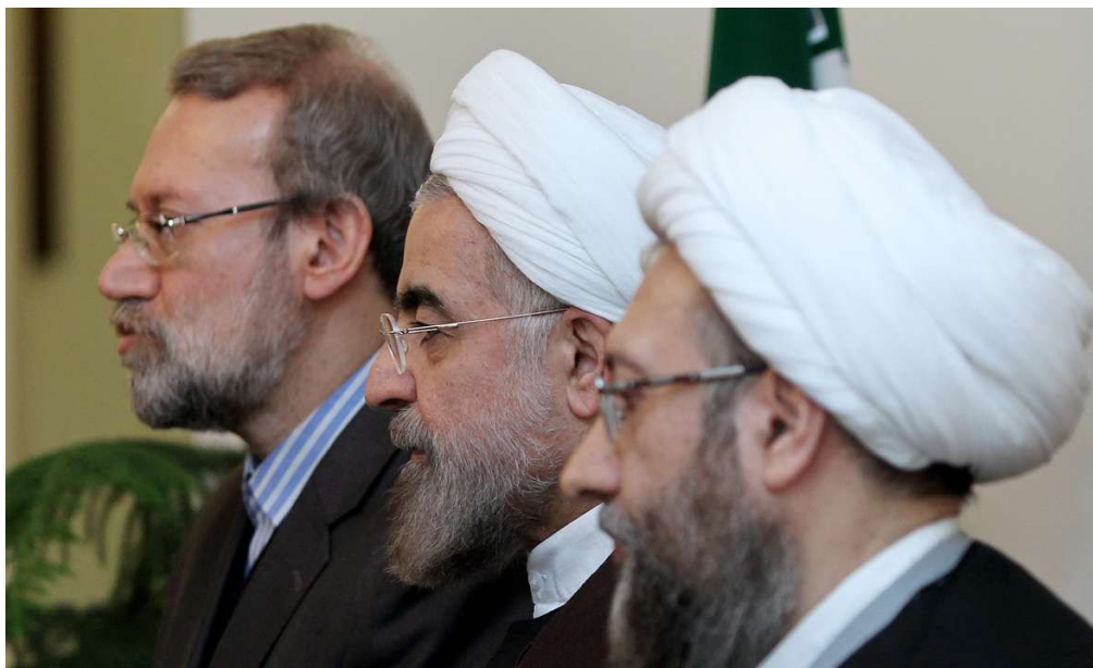
صادق آملی لاریجانی رئیس قوه قضاییه، حسن روحانی رئیس جمهوری و علی لاریجانی رئیس مجلس شورای اسلامی، روسای سه قوه.