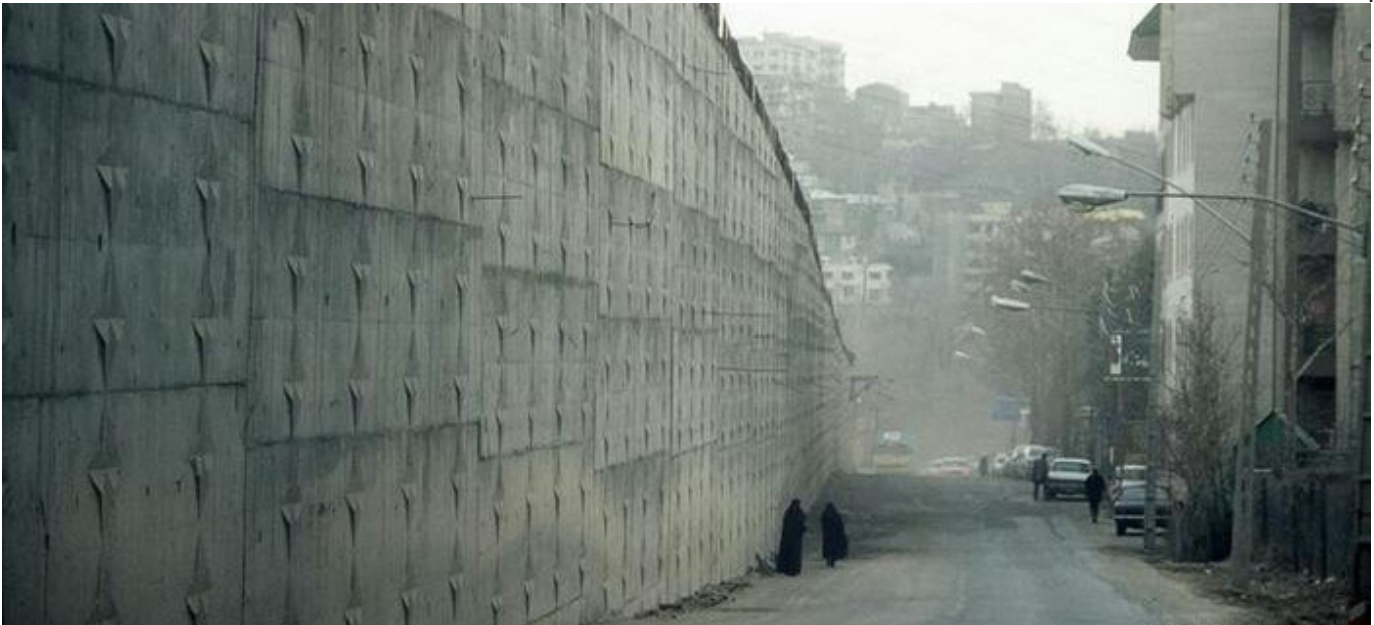
نمایی از دیوارهای بیرونی زندان اوین که در شمال شهر تهران واقع است.