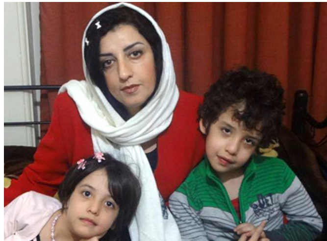
نرگس محمدی همراه با دوفرزانش در عکس دیده می شود. خانم محمدی بارها از تماس تلفنی با فرزندان خود منع شده است

از آنجا که هیچیک از این زنان نه به دلیل جرایم خشونت آمیز، بلکه به دلیل مخالفت مسالمت آمیز (که جمهوری اسلامی ایران تصمیم گرفته آنها را به عنوان جرم علیه امنیت ملی مورد پیگرد قرار دهد) محکوم شده اند، موازین سازمان ملل متحد به روشنی در مورد آنها به استفاده از شیوه های جایگزین حبس، و البته حقوق ملاقات کامل و با تفسیری سخاوتمندانه، دعوت می کند.