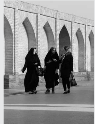
عکس جلد: زنان در حال قدم زدن در اصفهان، ایران.